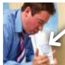
Sick bag 토사물 봉지