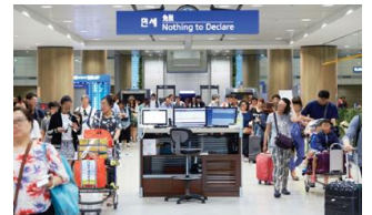
Airport customs 공항 세관