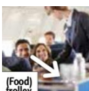
(Food) trolley. 기내식카트