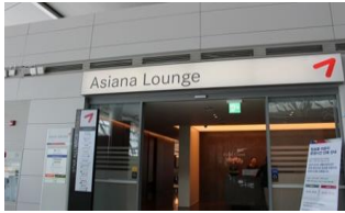
Airline lounge 항공사 라운지