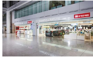
Duty Free Shop 면세점