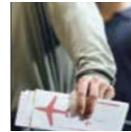
Boarding Card 탑승권