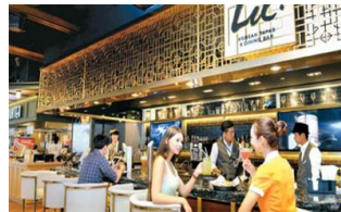
Airport Restaurants 공항 식당가