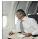
Window seat 창가쪽자리