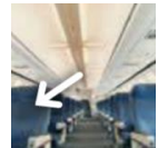
Aisle seat 복도쪽자리