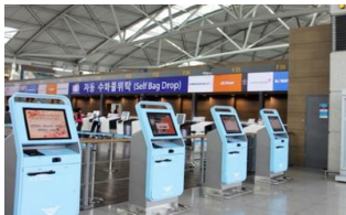
Self Check-in Kiosk 셀프 체크인 키오스크