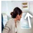
Emergency Exit 비상출구