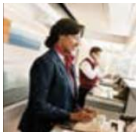
Check-in desk attendant 체크인카운터직원