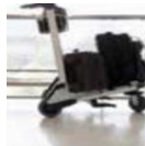
(Luggage) trolley 수하물카트