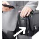
Hand luggage/carry-on bag 휴대용가방