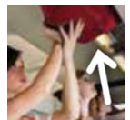
Overhead locker 좌석위 선반