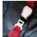
Safety belt/Seat belt 안전벨트