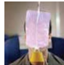
Oxygen mask 산소마스크