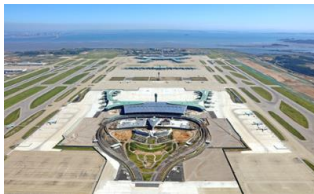
Runway / airstrip/landing strip 활주로