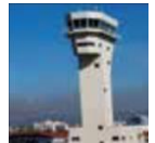
Control tower 관제탑