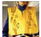
Life jacket 구명조끼