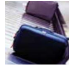
Baggage carousel 수하물컨베이어벨트