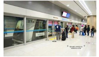
Airport Shuttle Train 공항 셔틀 트레인